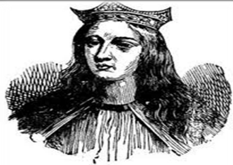
Doña Maria de Molina.

Ο μύθος, λέει ότι η Ρήγαινα έδωσε διαταγή να κτιστεί αυτό το κάστρο, η οποία όμως είχε σκληρή καρδιά και βασάνιζε τους εργάτες. Όταν τελείωσε η κατασκευή του, έδωσε διαταγή στους στρατιώτες της να πετάξουν στον γκρεμό τους εργάτες, για να μην αποκαλύψουν τα μυστικά της κατασκευής του. Κι έτσι κι έγινε. Ο μύθος τελειώνει λέγοντας πως η Ρήγαινα ζούσε κλειδωμένη στο κάστρο, μέχρι που πέθανε.